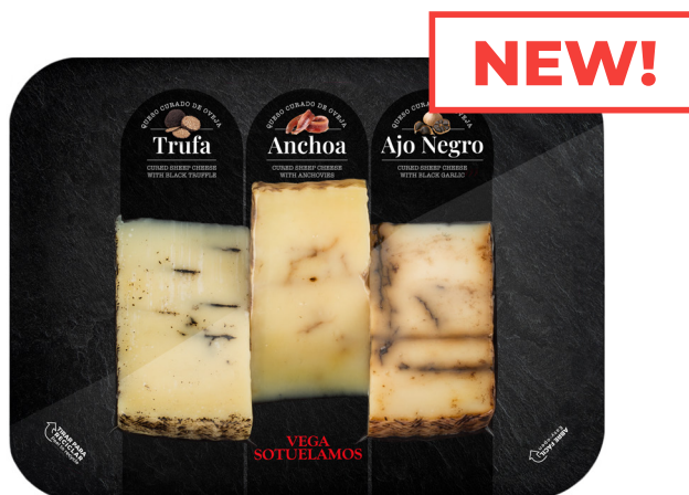
TABLA N°3 CON CUÑAS DE 100G TRUFA NEGRA, 100G DE ANCHOAS Y 100G DE AJO NEGRO

Table N°3 with wedges of 100g Black Truffle, 100g Anchovies and 100g Black Garlic