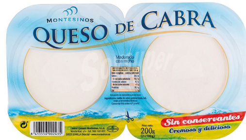
TABLA DE QUESO MADURADO DE CABRA